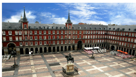
Plaza Mayor de Madrid

En arquitectura civil, las obras más destacadas son la Plaza Mayor de Madrid, proyectada por Juan Gómez de Mora y la Plaza Mayor de Salamanca (1729), realizada por Alberto Churriguera y García de Quiñones, donde destaca la horizontalidad, juego de arcos y proporciones.